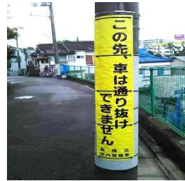
目立つようになりました

地域の方からのご意見により、「この先行き止まり」の目立たない看板を、黄色い表示旗を電信柱に巻き付け、目立つように安全対策をとりました。