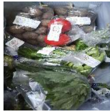
おまかせ野菜セット

子ども食堂再開しました。 新型コロナウイルス感染拡大予防のため3月からお休みしていた「福まね嬉子ども食堂」は6月18日(土)テイクアウト中心にしてリニューアルしました。時間帯も夜から昼間へ、そして地域の方ならどなたでも利用できる「だれでも食堂」にしました。この日は113食提供できました。