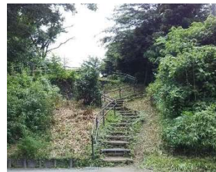
スッキリしました

西徳第二公園内の階段が雑草で生い茂り、見通しが悪く死角が発生していると地域の方からのご意見がありました。担当部署に相談したところ、さっそく雑草の伐採を実施してくれました。子供たちが安全に遊ぶよう、見通しがよい綺麗な公園になりました。